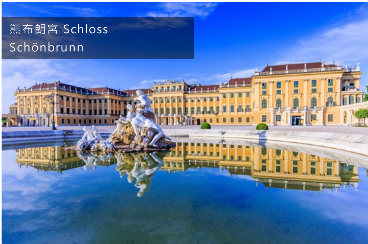
熊布朗宮 Schloss Schönbrunn

前往熊布朗宮→百水公寓外觀→返回河輪享用晚餐→前往莫札特與史特勞斯名曲演奏會【河輪預計今日晚間啟航】（奧地利）