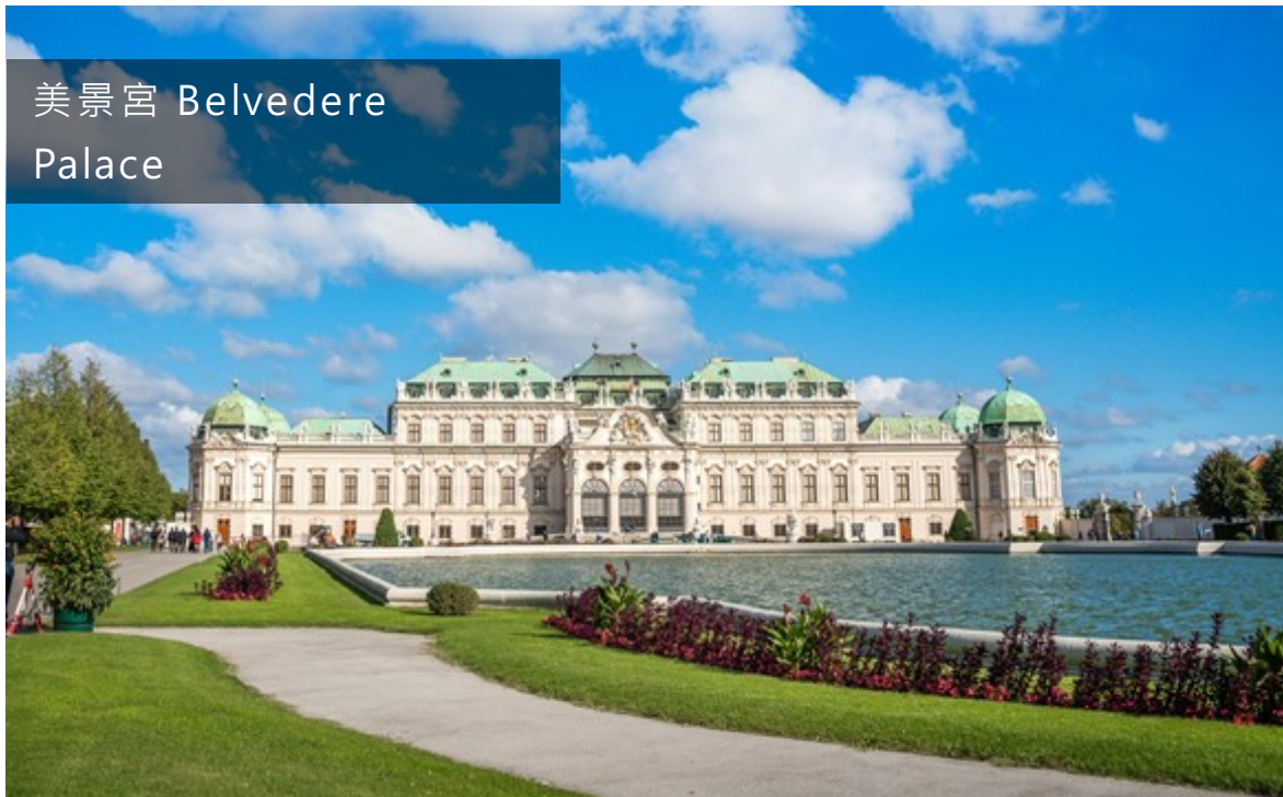
美景宮 Belvedere Palace

美景宮是位於奧地利首都維也納的一個巴羅克建築風格的宮殿。二戰期間宮殿曾遭到破壞，但在戰後得到修復。現在的貝爾維帝宮是奧地利美景宮美術館的所在地。奧地利0.2歐元硬幣使用了貝爾維帝宮作為圖案。（摘錄自Wikipedia）