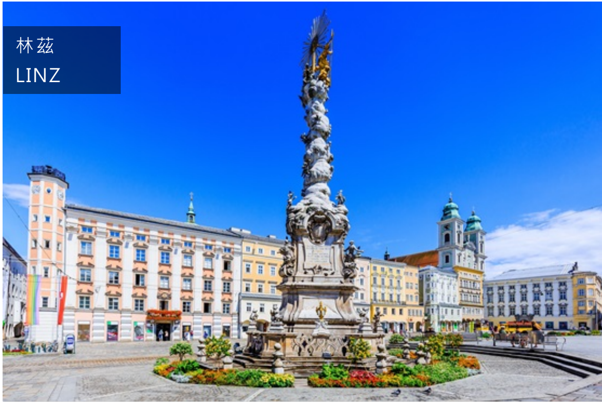
位在林茲主廣場西部的聖三柱。