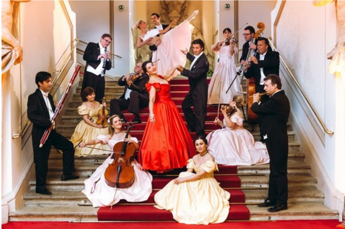
莫札特與史特勞斯名曲演奏會

美泉宮全體採用金色和黑色，是長期統治著奧地利的皇室——哈布斯堡家族的代表顏色，總面積達2.6萬平方米。~摘錄自Wikipedia~