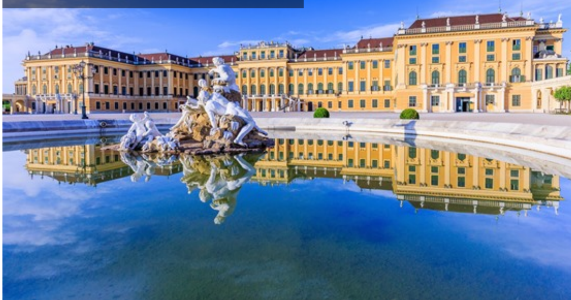
熊布朗宮 Schloss Schönbrunn

熊布朗宮，又譯美泉宮，是一座充滿巴洛克藝術的皇家建築，位於奧地利的首都維也納，此宮曾是神聖羅馬帝國、奧地利帝國和奧匈帝國的御用宮殿。~摘錄自Wikipedia~