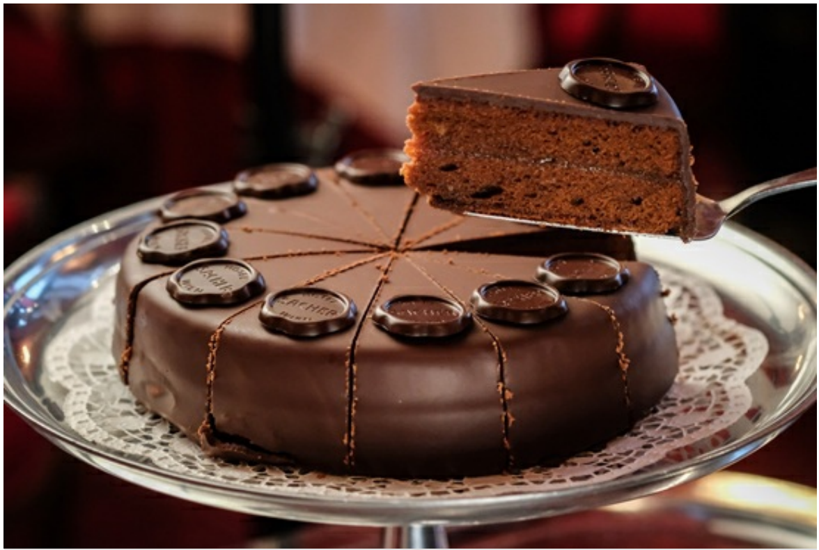
品嘗維也納街頭風味