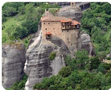
聖尼可拉斯修道院