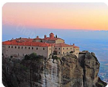
聖史蒂芬諾斯修道院