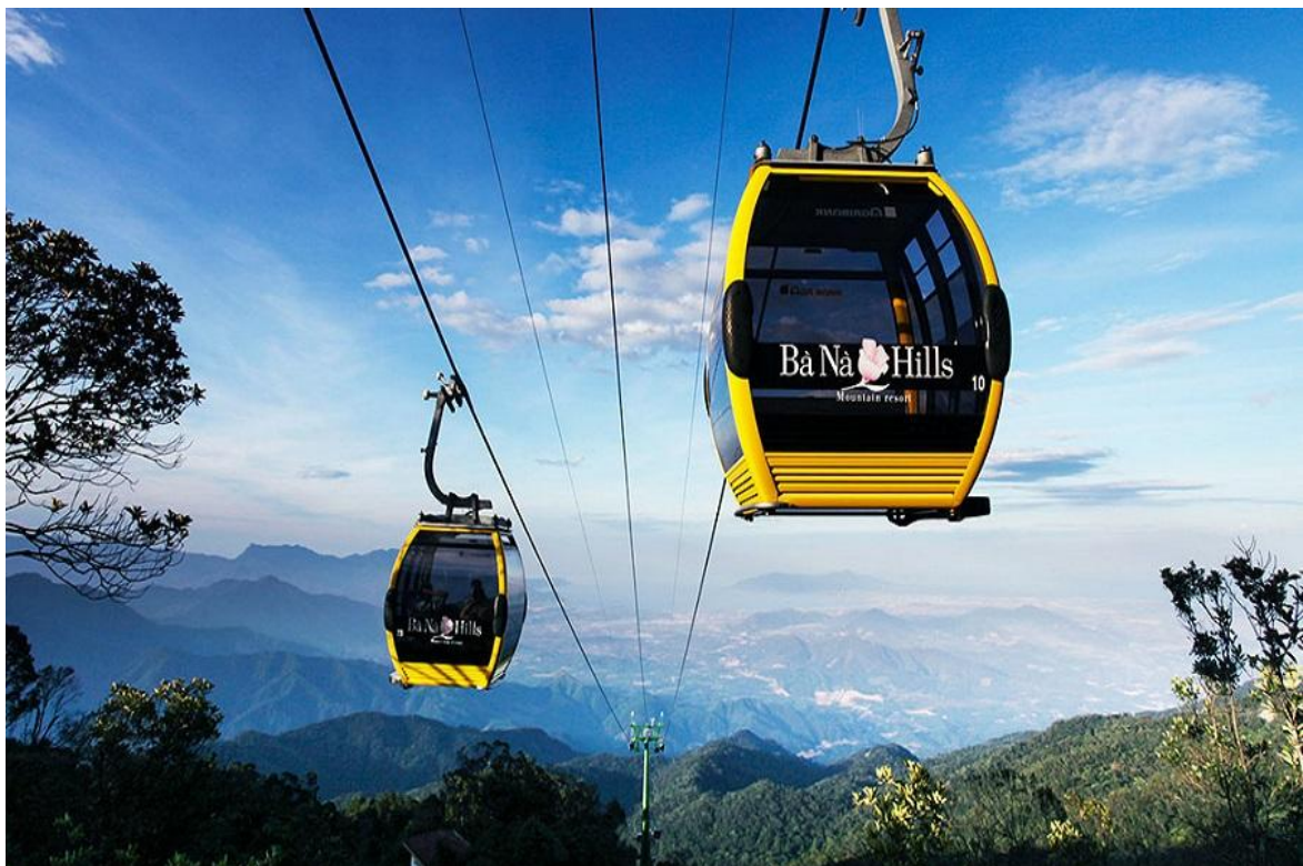
【法國山城Ba Na Hills】

【Golden Bridge巨石黃金橋】這座橋樑以其優雅的設計令遊客嘆為觀止，矗立於巴拿山上方海拔1400米處，看似被一雙巨大石手托著的金橋，瞭望周圍鄉村的壯麗景色，金色步道兩旁種了許多石蓮菊花，延伸了近150米，橋樑的設計來自Ta Landscape Architecture的公司，看似是用石頭雕刻出來的，實際上確是用玻璃纖維完成的。黃金橋耗資20億美元，整個建築耗時約一年，於2018年6月對外開放。隨著越南峴港旅遊的熱潮，越來越多人發現峴港這個美麗的城市。