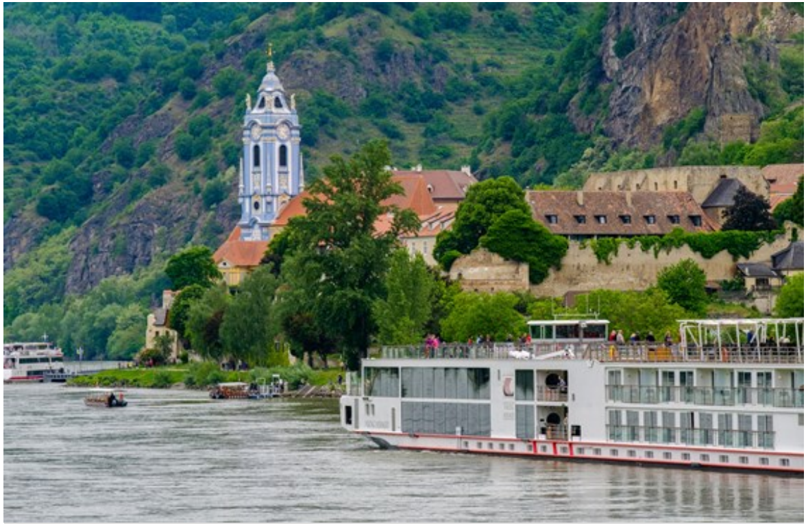
瓦豪河谷 杜恩施坦因 Dürnstein