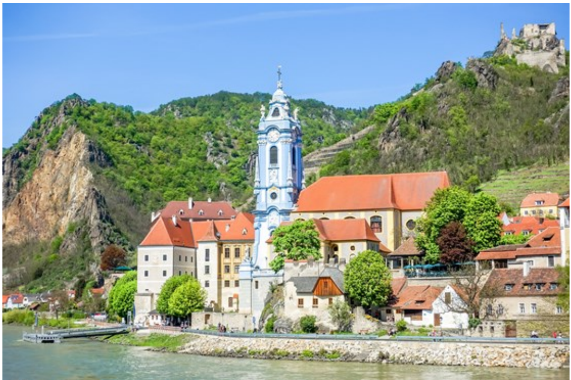
瓦豪河谷 杜恩施坦因

◆ 漫遊施皮茨小鎮 ：風景如畫葡萄滿園的施皮茨小鎮，坐落在世界遺產瓦豪河谷中心區域的『千桶山』上。在導遊的陪同下，我們將參觀這個歷史悠久的葡萄酒小鎮，穿過蜿蜒的鵝卵石街道，欣賞周圍文藝復興時期和巴洛克風格的房屋，感受被河流與美酒浸潤的小鎮風情。除了葡萄以外，杏仁也是這裡遠近馳名的特產之一，我們將帶您體驗當地富有特色的杏仁製品、葡萄酒品嘗。遊覽結束後，返回船上享用午餐，河輪將往德國駛去，您可在船上享受悠閒時光。