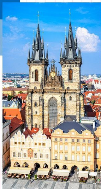
歐洲最美麗的城市之一