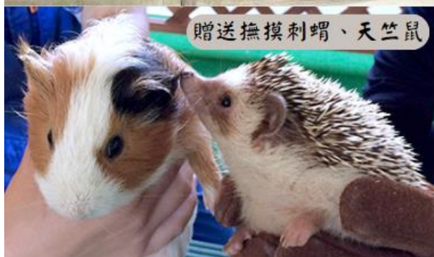
贈送撫摸刺蝟、天竺鼠