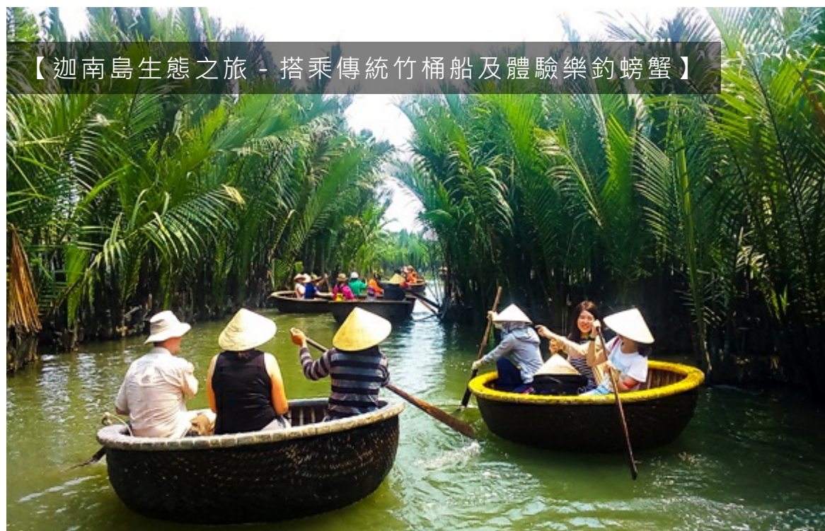
【迦南島生態之旅 - 搭乘傳統竹桶船及體驗樂釣螃蟹】

會安/(船程約30mins)漫遊迦南島～桶船生態之旅(竹筒船體驗+樂釣螃蟹趣) (體驗約60mins)-會安古鎮(世界文化遺產)【福建會館、陳富街、日本橋】