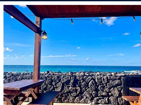
超級海景霸氣龍蝦之家 (兩人一隻+炒飯)