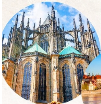
聖維特大教堂 St. Vitus Cathedral