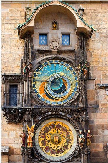
布拉格天文鐘 Prague astronomical clock

是捷克首都布拉格的一座中世紀天文鐘， 座落於老城廣場的老城市政廳的南面牆上， 是一個熱門的旅遊景點。