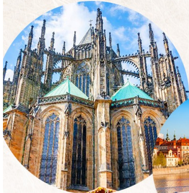
聖維特大教堂 St. Vitus Cathedral