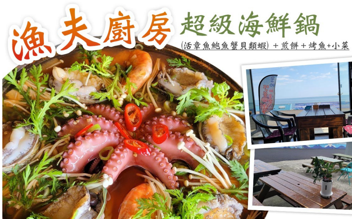
漁夫廚房 超級海鮮鍋 (活章魚鮑魚蟹貝類蝦) + 煎餅 + 烤魚 + 小菜