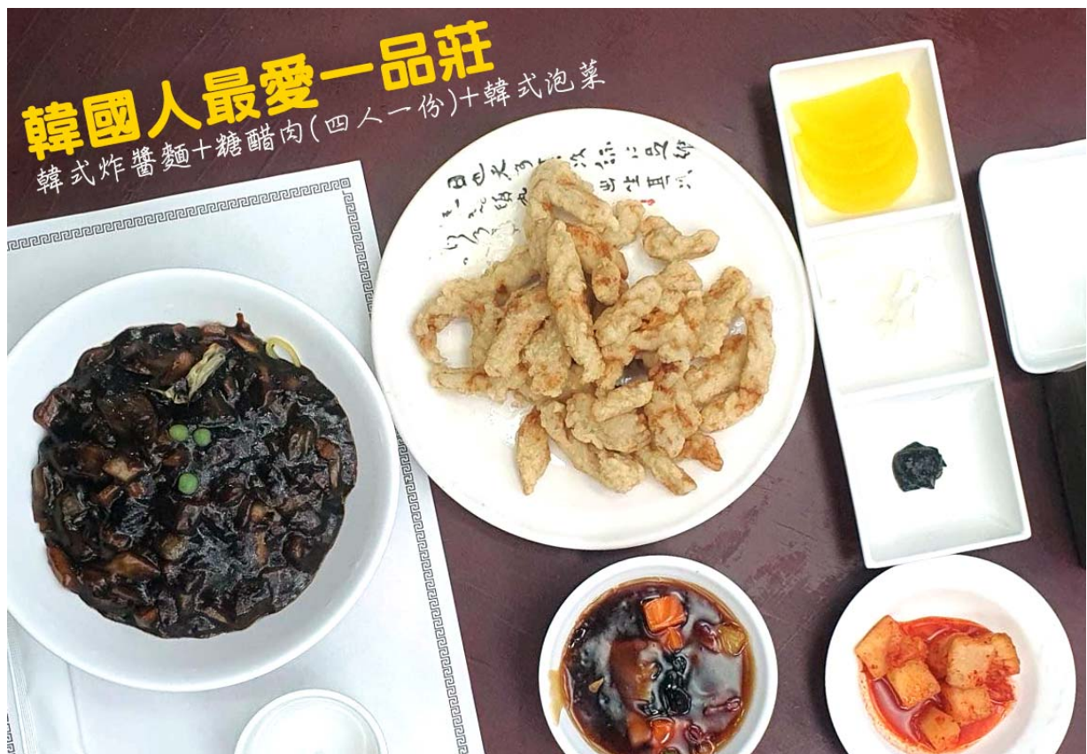
韓國人最愛一品莊 韓式炸醬麵+糖醋肉(四人一份)+韓式泡菜