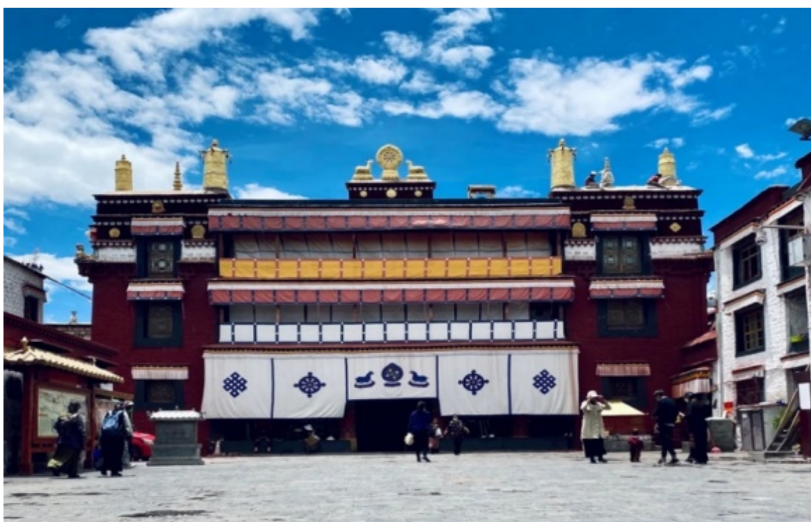
【 色拉寺 】