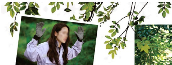
韓劇《愛的迫降》孫藝珍迫降到的森林之地