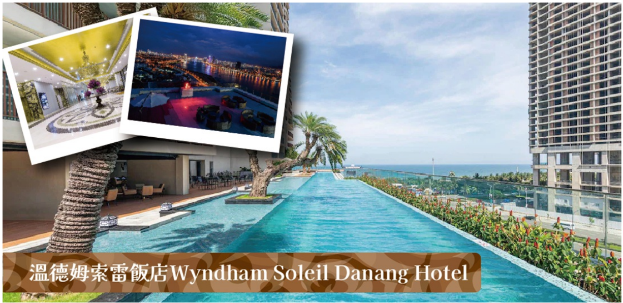
溫德姆索雷飯店 Wyndham Soleil Danang Hotel