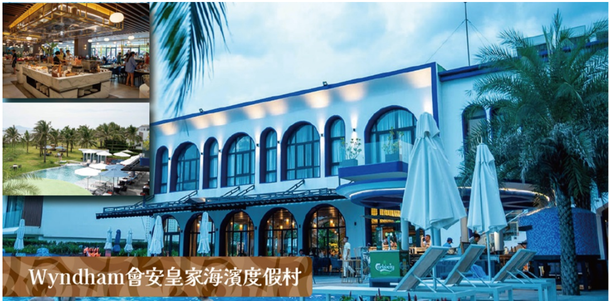
Wyndham 會安皇家海濱度假村