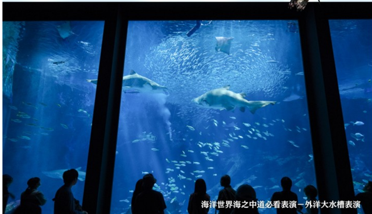
海洋世界海之中道必看表演—外洋大水槽表演

海中道海洋世界以九州海域為主題，是九州最大規模的水族館，展示350種海洋生物。從精彩萬分的海豚和海獺表演，到可愛小海獺餵食秀，是很適合親子同遊的福岡必訪景點！