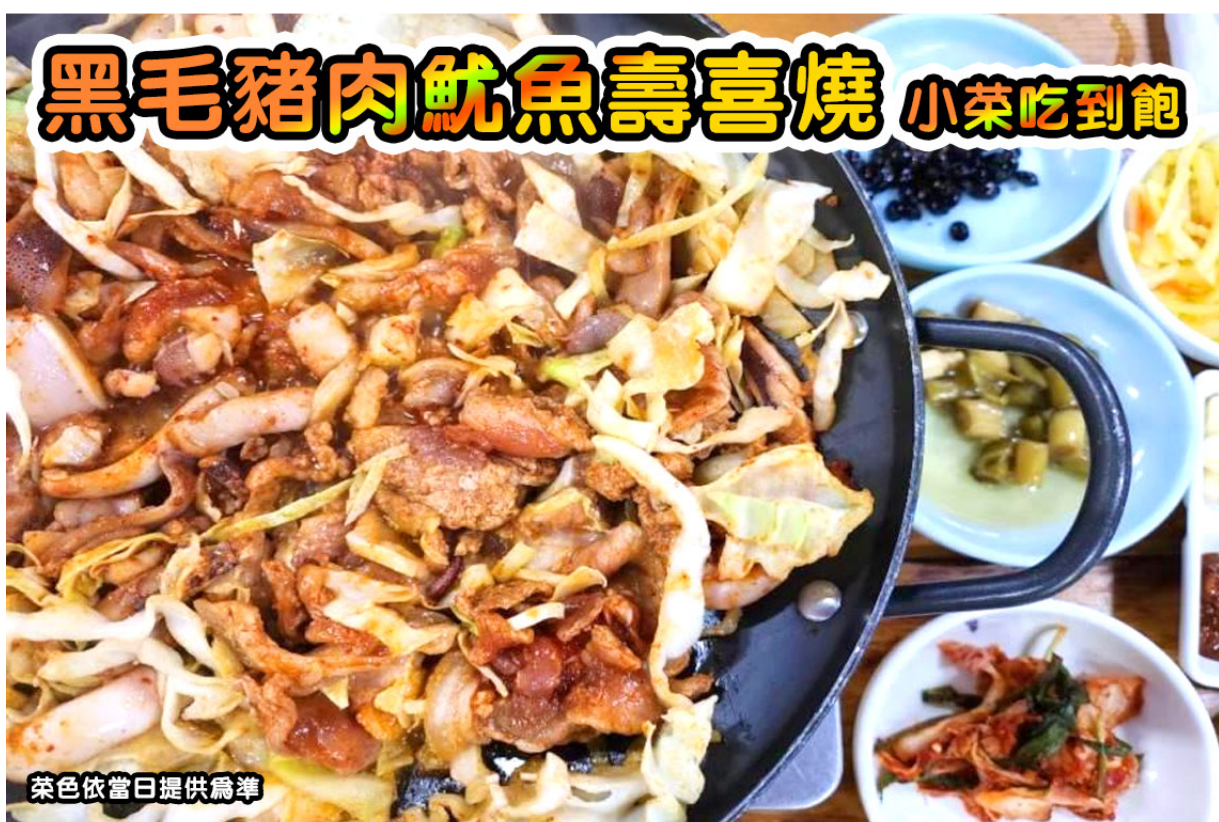
菜色依當日提供為準