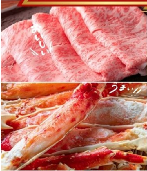
※圖片僅供參考以實際現場為主