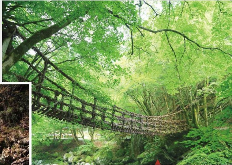
「かずら橋」-祖谷藤橋