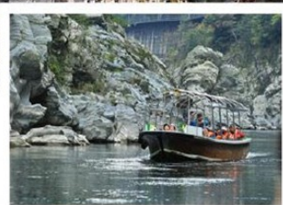
特別安排 搭乘遊船賞美景

在搭乘遊船的30分鐘航程中，可以欣賞德島大步危峽谷的壯麗風光。上船之後可以脫掉鞋子，悠閒地坐在榻榻米上順流而下，有充分的時間可以欣賞碧綠的湖水及兩岸聳立的岩壁。由大步危峽出發，順流而下可進一步體驗山谷之美，沿途溪谷岩壁交錯，可見識到德島縣天然紀念物~蝙蝠岩、獅子岩等特殊奇景。也被稱為《日本三大秘境》之一。