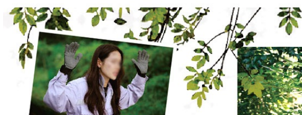
韓劇《愛的迫降》孫藝珍迫降到的森林之地

這裡現有400餘棟房屋，被指定為韓國民俗資料保護區，以茅草覆蓋的屋頂，石頭疊砌的院牆，以及用“丁囊”取代門戶的民宅，質樸可愛，至今仍有人在這裡居住生活。