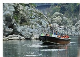
特別安排 搭乘遊船賞美景