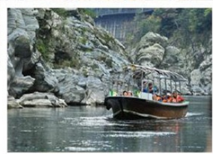
特別安排 搭乘遊船賞美景