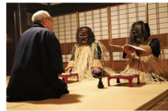
生剎神館、真山傳承會館

男鹿半島最兇神惡煞的守護神生鬼，震天的渾厚叫聲以及張牙舞爪的姿態讓人永生難忘，生剎神館裡可看到來自各地的生鬼面具，還可體驗變裝成生鬼模樣，一旁的真山傳承館則可以實際體驗生鬼的特典活動，看著面露兇惡的生鬼大搖大擺地走進來，一場實境秀就活生生地在眼前上演。