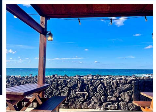
超級海景霸氣龍蝦之家 (兩人一隻+炒飯)