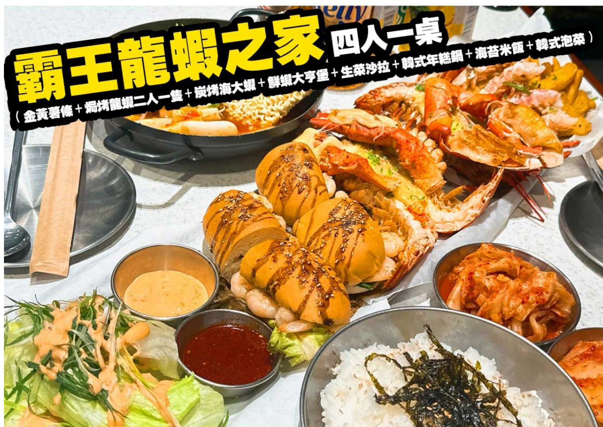
霸王龍蝦之家 四人一桌 (金黃薯條 + 焗烤龍蝦二人一隻 + 炭烤海大蝦 + 鮮蝦大亨堡 + 生菜沙拉 + 韓式年糕鍋 + 海苔米飯 + 韓式泡菜)