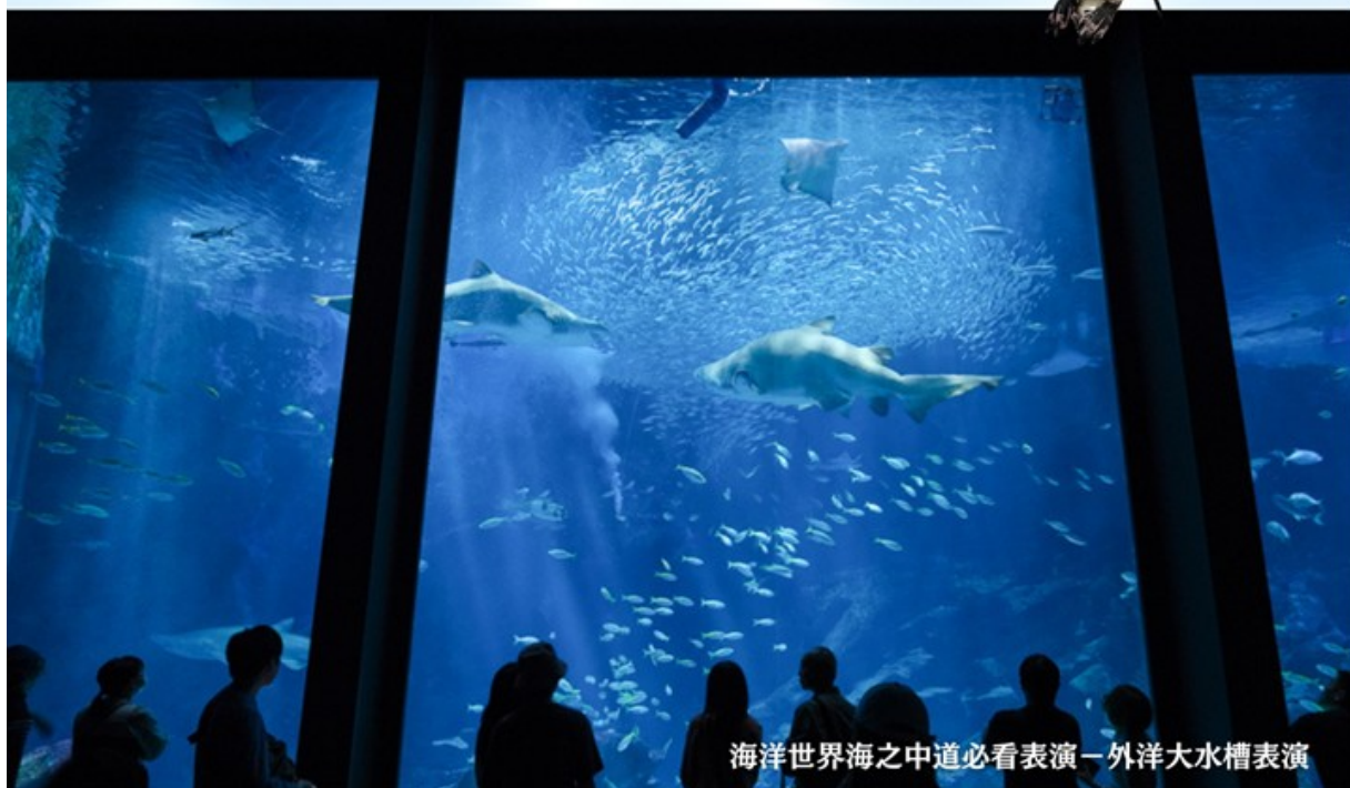
海洋世界海之中道必看表演－外洋大水槽表演