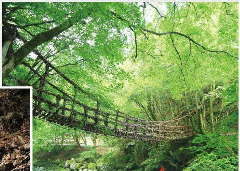
「かずら橋」-祖谷藤橋