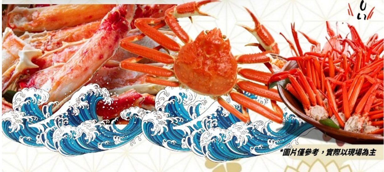
*圖片僅參考，實際以現場為主